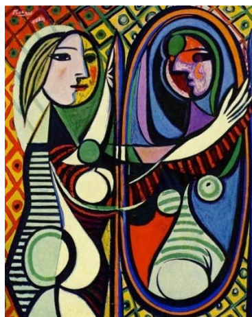
"Garota Diante do Espelho" (1932) Picasso

As 3 fases da vida ou as duas imagens de cada indivíduo?