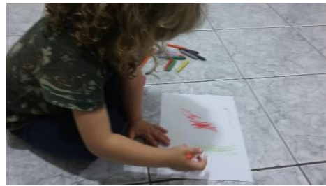
Estudo das garatujas. Trabalho apresentado pelas educadoras do CEMEI “Marilena Cabral” (Campinas) durante o Curso Humanarte Campinas 2015