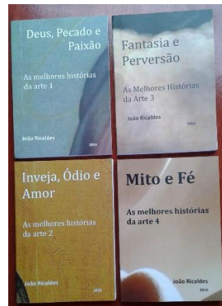
A série “As melhores histórias da arte”